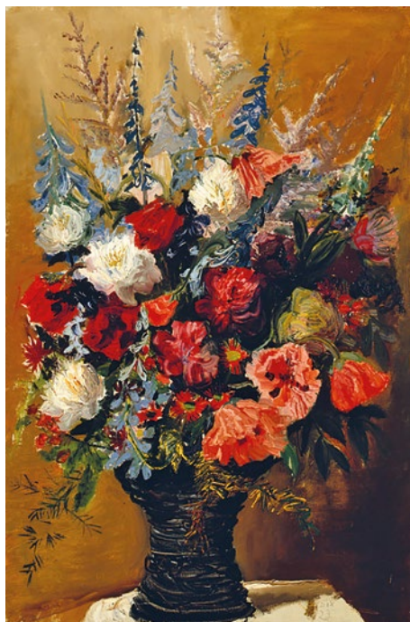
OTTO DIX: »DER BLUMENSTRAUSS«