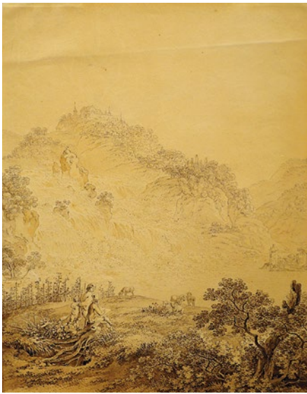
ADRIAN ZINGG: »RHEINFALL BEI SCHAFF- HAUSEN«