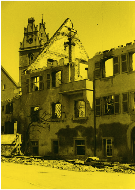
ABB — Die archäologisch-heimatkundliche Sammlung verblieb während des Krieges im Museumsgebäude und wurde zerstört. Ruine des Städtischen Museums 1944, Ecke Karlsstraße.