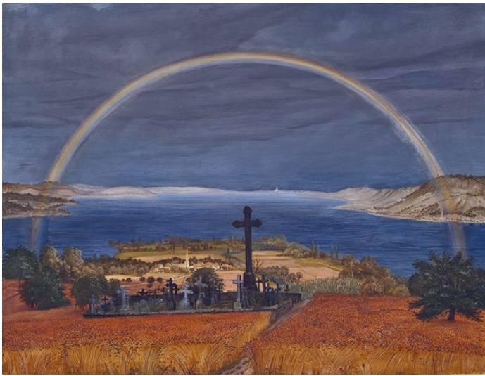
OTTO DIX: »BODENSEELANDSCHAFT MIT REGENBOGEN«