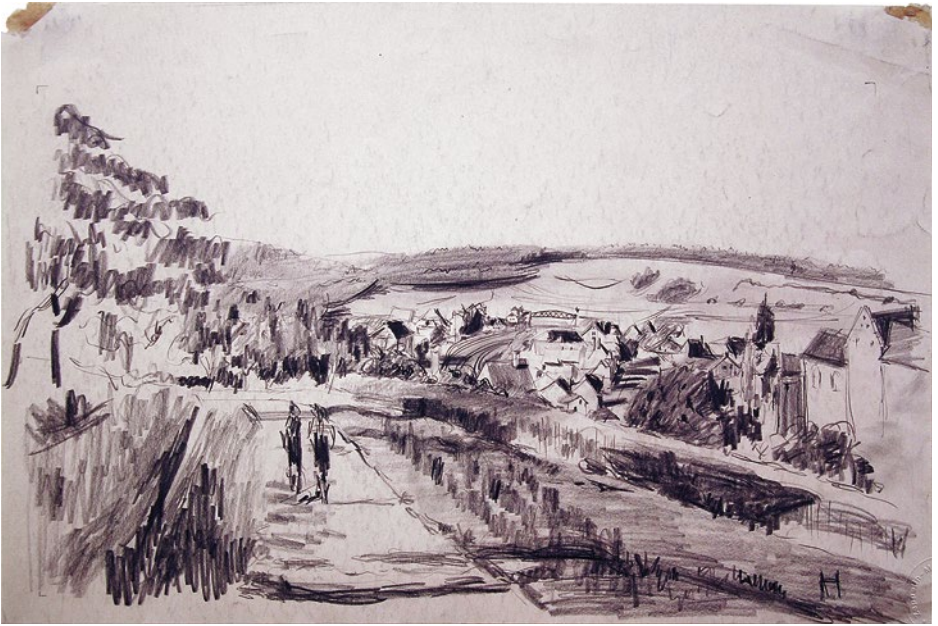
ERNST HASSEBRAUK: »BLICK AUF DEN BODENSEE« 1934, Bleistift und Kohle auf Papier

Der gebürtige Dresdner Künstler Ernst Hassebrauk (1905–1974) ist für seine farbintensiven Gemälde und eine unruhige Stilistik bekannt, die der Tradition des Expressionismus nahe steht. Diese Zeichnung fertigte er auf einer Studienreise an den Bodensee. Trotz der zum Teil hastig gesetzten Bleistiftlinien zeigt sich der Künstler hier von einer eher klassischen Seite: In der landschaftlichen Idylle der zur Rechten liegenden Stadt Meersburg und des Bodensees gehen zwei Menschen auf einem erhöhten Weg entlang. (FS)