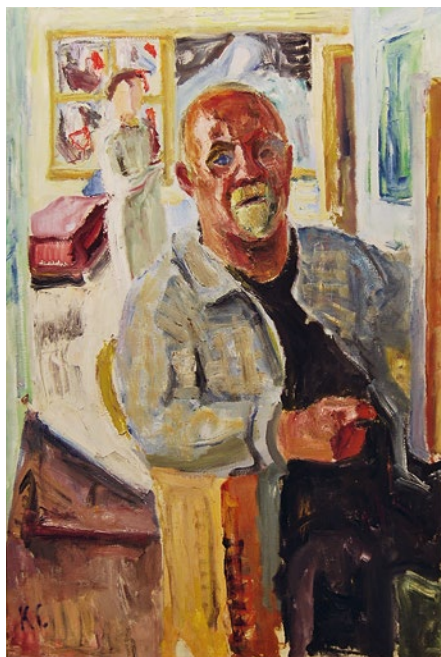
KARL CASPAR: »SELBSTBILDNIS IM ATELIER« um 1927, Öl auf Leinwand

Unter den wenigen Selbstbildnissen zeigt dieses Caspar (1879–1956) als selbstbewussten Künstler. Der Professor für Malerei an der Akademie in München sitzt hier in einem Korbstuhl und ist im Begriff, auf der vor ihm stehenden Leinwand zu malen. Sein Blick geht allerdings direkt aus dem Bildraum hinaus und fixiert ernst das betrachtende Gegenüber. Mit unruhigen Strichen gemalt, übersieht man schnell eine Frauengestalt im Hintergrund, Maria Caspar-Filser. Gedeutet wird das Gemälde als Huldigung Caspars an die Liebe zur Malerei und zu seiner Frau. (FS)