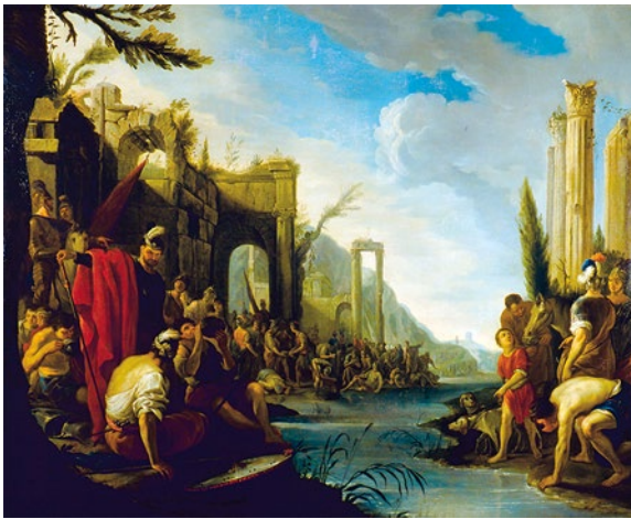
JOHANN HEINRICH SCHÖNFELD (?): »GIDEON MIT SEINEN KRIEGERN AM JORDAN«