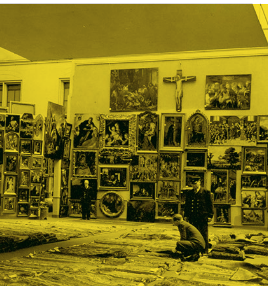
ABB — Im Rijksmuseum in Amsterdam, Sichtung der von den Nationalsozialisten beschlagnahmten und verschleppten Kunstwerke, 1950.

In many of the examined cases the question of looted art cannot be answered conclusively. However, the aim of the exhibition is to create transparency, to draw attention to the necessity of ongoing research, and to rule out, as far as possible, that the museum is in possession of artworks derived from thefts or confiscations.